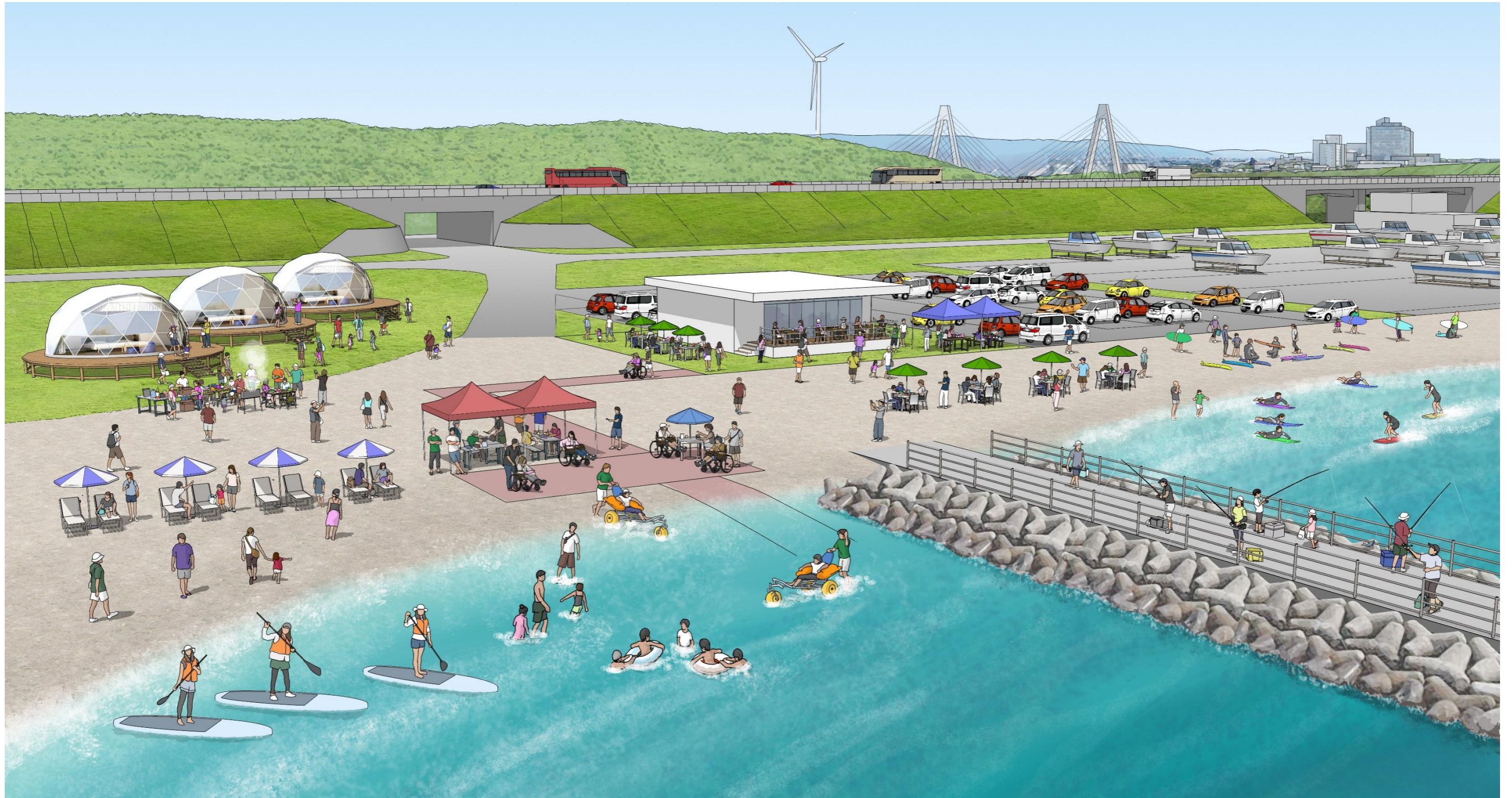
イメージパース 放水路（海側）拠点

（このイラストは構想で示す方向性をイメージ化したもので、実際の整備内容ではありません）