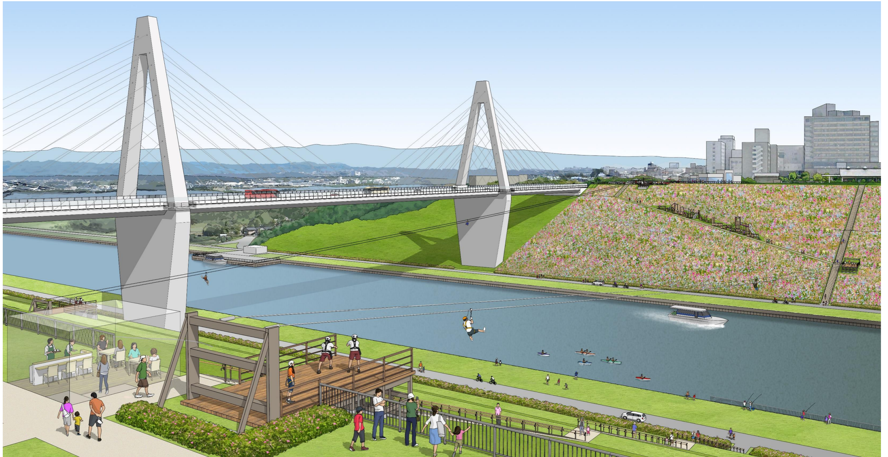
イメージパース 放水路（潟側）拠点

（このイラストは構想で示す方向性をイメージ化したもので、実際の整備内容ではありません）