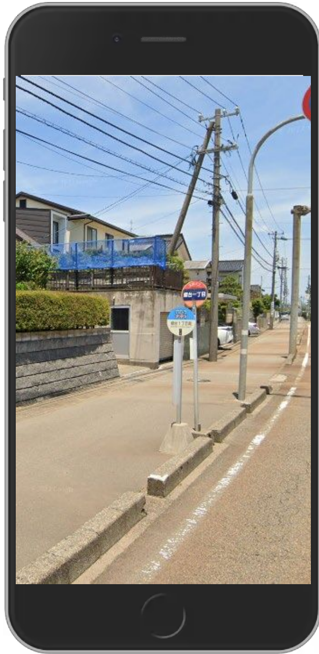
ストリートビュー表示