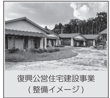
復興公営住宅建設事業 (整備イメージ)

新たに地籍調査室を設置し、側方流動により、ずれた土地の境界を再確定するため、測量業務を実施します。