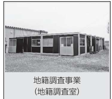
地籍調査事業 (地籍調査室)