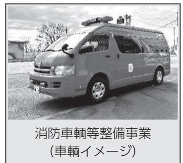
消防車両等整備事業 (車輛イメージ)