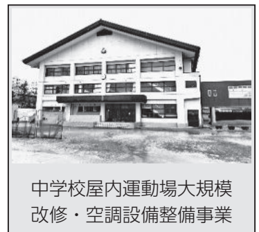
中学校屋内運動場大規模 改修・空調設備整備事業

子どもの健やかな成長を助長し、児童福祉の増進を図るため、新たにチャイルドシート購入費の助成を行います。