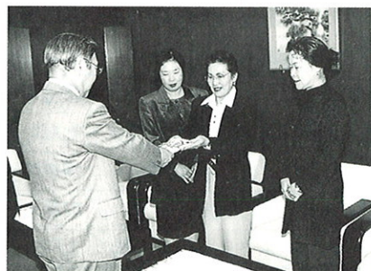
内灘町連合婦人会

○内灘町商工会婦人部 ○内灘町連合婦人会 から各地区を通じて 集められた歳末寄附 金を町社会福祉協議 会へ寄附していただ きました。