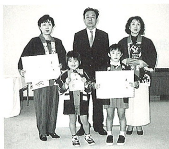
誠美幼年消防クラブと鶴ヶ丘北婦人防火クラブ