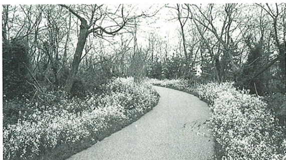
林帯遊歩道に咲き乱れるはまだいこん（通称）の花（撮影 4月下旬）