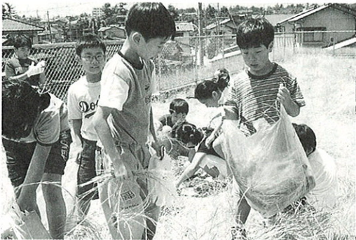
むしってもむしっても、まわりは草だらけ。