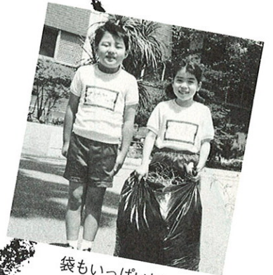
袋もいっぱいになりました。

今日のハマナスタイムはみんなで草むしり。給食の終わったあと、一年生から六年生まで、みんな一緒に学校のまわりの清掃作業をしたんだ。軍手をはめていっしょうけんめい草を抜いたけど、根っこが深くてなかなかたいへん。おもわずしりもちをついた子もいたよ。でも終わったあとはすっかりきれいなっていい気持ち。