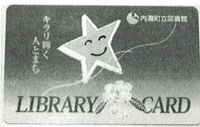
新しくなった貸出しカード