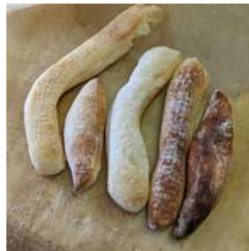
「ミルクスティックパン」