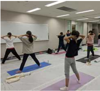
【1】、【4】骨盤・体幹ストレッチ