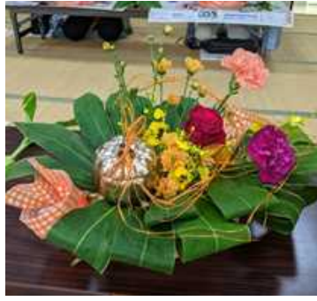
「パンプキン不思議な世界」