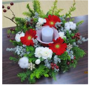
「キャンドルアレンジメントフラワー」