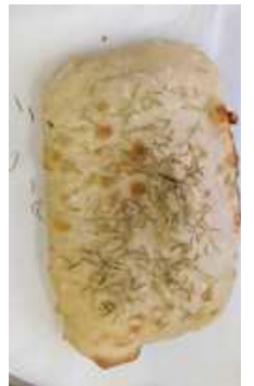
「ドデカフォカッチャ」