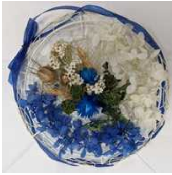
「青色系ワイヤーフレーム」