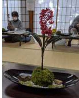
「苔を使った和風かざり」