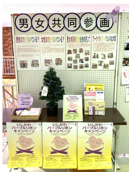
<文化芸術祭の展示コーナー>

事業成果：3年ぶりに文化芸術祭においてパネル展示を実施し、来場された幅広い世代、また外国籍の町民に向けても周知啓発を行うことができた。