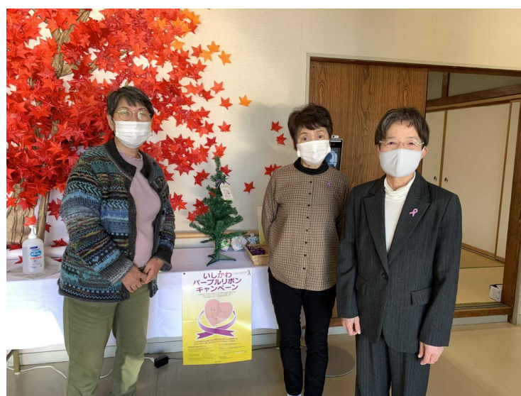
<石川県男女共同参画推進委員による設置の様子>