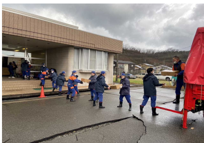
能登半島地震後の支援物資搬入