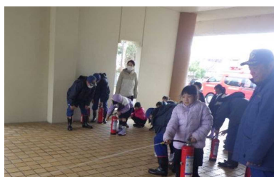
消防団による小学生対象防災教育