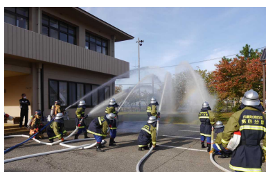
火災防ぎょ合同訓練