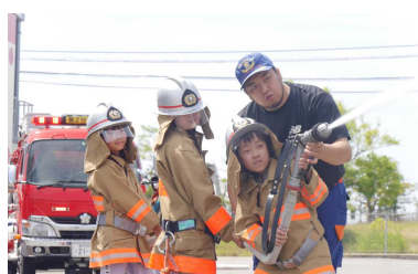
わくわく土曜体験教室